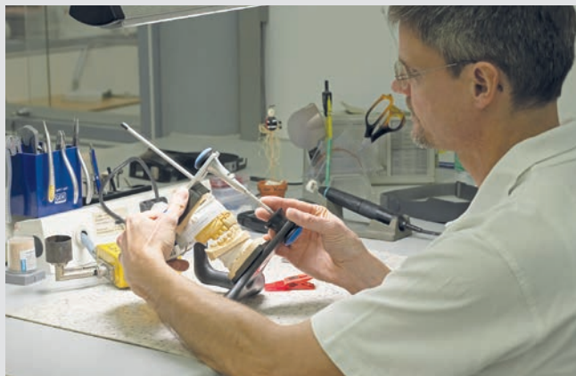
Der Zahntechnikermeister bei der Qualitätskontrolle: Die Anfertigung von Zahnersatz erfordert viel handwerkliches Können und Erfahrung

Ein solches Ziel zu erreichen, stellt für Zahntechniker immer eine Herausforderung dar, die nur in enger Abstimmung mit dem behandelnden Zahnarzt gelingen kann. Es ist deshalb sehr oft notwendig, dass der Zahntechniker bei der Farbbestimmung in der Zahnarzt-Praxis anwesend ist. Übrigens ist es so auch dem Patienten möglich, seine persönlichen Wünsche nochmal mit dem Zahntechniker zu besprechen. Für einen Keramiker in Singapur dürfte die Anreise in eine deutsche Zahnarzt-Praxis allerdings kaum machbar sein.